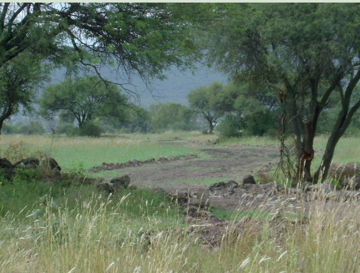
DENTRO DEL PREDIO SE LOCALIZAN VARIOS CAMINOS INTERPARCELARIOS LOS CUALES NO TIENEN UN TRAZO DEFINIDO NI TAMPOCO UNA SECCION CONSTANTE.