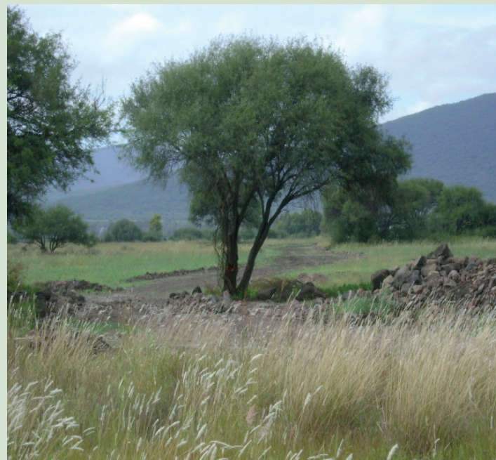
VISTA AL INTERIOR DEL PREDIO

3.- Asimismo se procedió a realizar una visita física al predio de referencia en el cual se pudo observar que el mismo se encuentra en su estado natural, y a la fecha no se han realizando ningún tipo de trabajos de construcción y/o obras de urbanización dentro del mismo, también físicamente se pudo constatar que no existe vialidad alguna dentro del predio; únicamente se localizaron caminos inter parcelarios sin consolidar y sin trazo alguno.