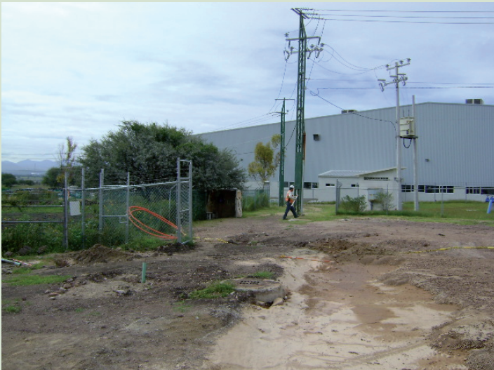
EL PREDIO SE ENCUENTRA EN SU ESTADO NATURAL SIN REALIZAR A LA FECHA NINGUN TIPO DE OBRA DE URBANIZACION.